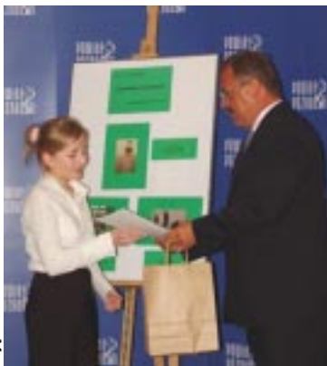
Laureatom konkursów nagrody wręczył Starosta Poznański Jan Grabkowski