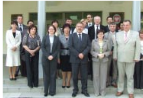
Przedstawiciele Ministerstwa Edukacji gościli w powiecie w dniach od 17 do 18 maja br.