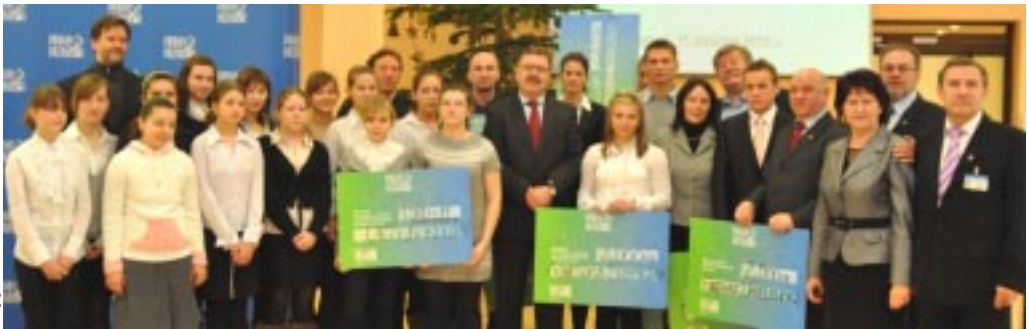
Nagrody sportowcom i trenerom wręczył Starosta Poznański oraz Radni Powiatu w Poznaniu