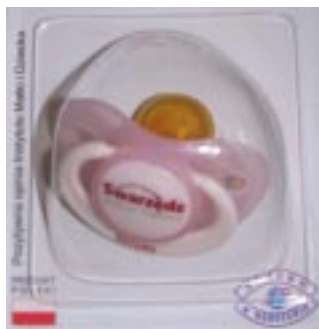
Smoczek dla malucha rozdawany będzie także w kolejnych miesiącach nowego roku

W Swarzędzu, aby podkreślić bożonarodzeniowy okres, świeżo upieczeni rodzi-