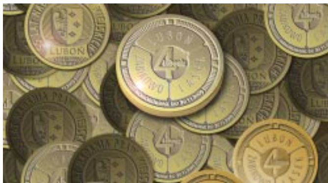
Luboński dukat „na szczęście”