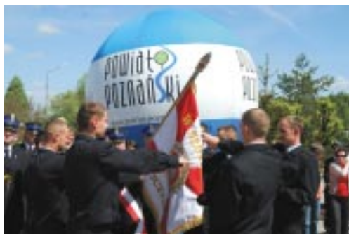
Ważnym elementem obchodów było złożenie ślubowania przez strażaków wcielonych do służby w Komendzie Miejskiej PSP w Poznaniu

W czasie obchodów wręczono szereg wyróżnień, odznaczeń i mianowań na wyższe stopnie strażaków Komendy Miejskiej Straży Pożarnej w Poznaniu oraz druhowów jednostek OSP. Odznaczenia i wyróżnienia otrzymały także osoby zasłużone we wspieraniu działalności PSP i OSP. Po części oficjalnej rozpoczął się festyn rodzinny, na którym nie zabrakło tradycyjnej grochówki, muzyki oraz rozrywki dla zgromadzonych dzieci i młodzieży. Tę ostatnią zapewnili kierownicy komórek organizacyjnych Komendy Miejskiej PSP w Poznaniu,