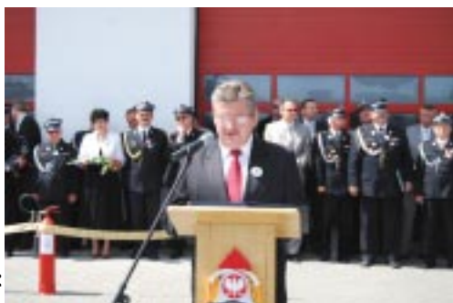
Zwycięzcom konkursu „Strażak Roku Powiatu Poznańskiego” gratulacje złożył Przewodniczący Rady Powiatu w Poznaniu