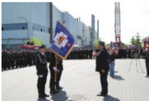
oraz przekazanie sztandaru Oddziału Powiatowego Związku Ochotniczych Straży Pożarnych RP w Poznaniu