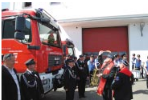
Podczas uroczystości poświęcono nowo zakupione wozy bojowe dla OSP w Mosinie, Kórniku i Swarzędzu